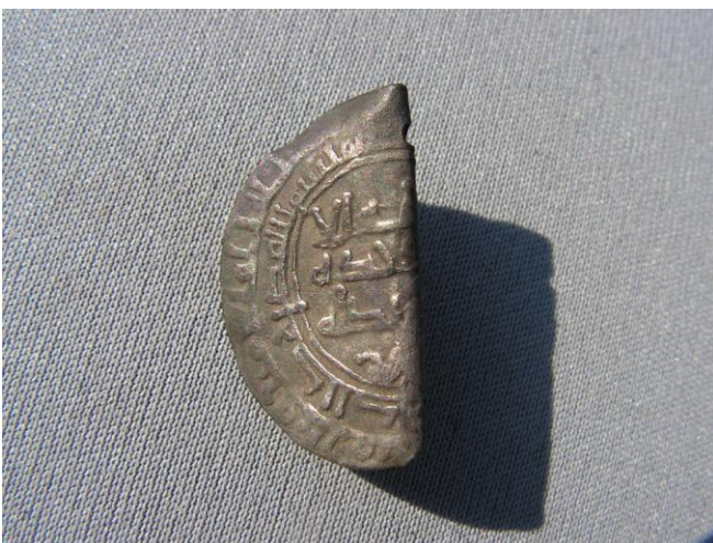
En af 46 arabiske vikingetids sølvmønter fundet på Havsmarken, Ærø.