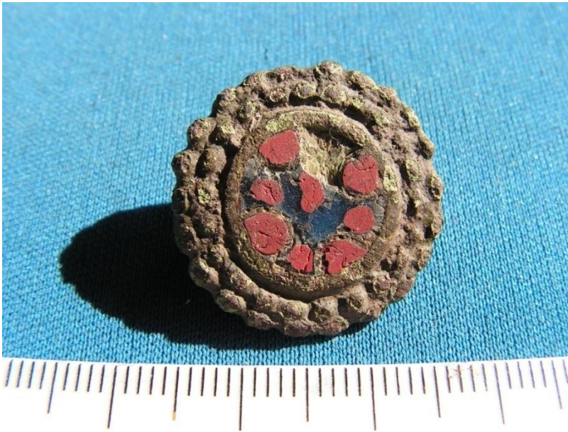
Spænde med emallering fundet på Havsmarken, Ærø.