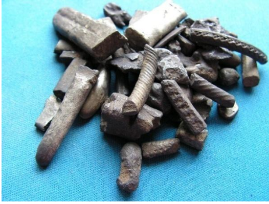
Brudsølv til at handle med fundet på Havsmarlen, Ærø.