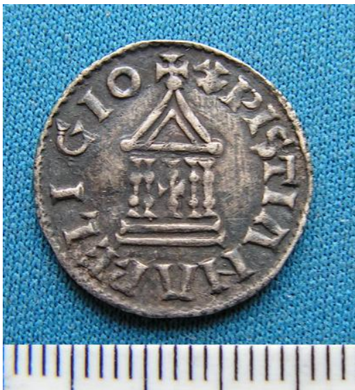
Frankisk sølv mønt fra Ludvig den Frommes tid fundet på Havsmarken, Ærø.

Langelands Museum, der har ansvaret for arkæologien på Ærø, har i denne uge foretaget en udgravning på det gamle strandmarked, der skal hjælpe til at afklare dets karakter og danne grundlag for en sikkerhedsvurdering af pladsen. Der er tilsyneladende tale om et strandmarked uden bygninger eller markante strukturer. Som på den ældre Lundeborg strandmarked, har man sandsynligvis benyttet sig af lette boder og telte. De rige bebyggelser, der uden tvivl har knyttet sig til markedet, har nok ligget længere inde i landet i sikkerhed for angreb fra søsiden, hvor alle typer rejsende jo har kunnet komme forbi.